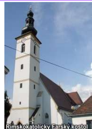
Rímskokatolícky Farský kostol

Evanjelický kostol - je to prvá budova postavená v Pezinku v klasicistickom slohu. Vybudovali ho roku 1783. Má jednoduchú architektúru. Pôvodne bol bez veže, tú dostavali v rokoch 1857 - 1860 v neogotickom slohu. Kostol má jeden oltár, kazateľnicu, krstiteľnicu a organ.