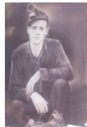
Isaac "Potter" Potter

Pred rokom 1337, z ktorého pochádza najstaršia písomná zmienka o osade Seunich – neskoršej Novej Bane, narazili na tomto území ťažiarci z Pukanca na zlatonosné žily. Zo vzrastu počtu mlynov na drvenie rudy možno usudzovať, že boli veľmi výnosné. V roku 1345 získala postavenie slobodného kráľovského a banského mesta a postupne dostala i výsady: právo trhu, právo meča, míľové právo. Najväčší rozmach baníctva a stredovekého mesta je zaznamenaný v 2. polovici 14. storočia, kedy sa Nová Baňa zaradila medzi sedem hornouhorských banských miest. Po krátkej epoche rozkvetu, zažíva však mesto, vtiahnuté do víru vnútorných nepokojov v Uhorsku a protitureckých vojen jednu ranu osudu za druhou – zničenie mesta Turkami v roku 1664, stavovské povstania a morovú epidémiu, ktoré mesto v 17. storočí takmer vyľudnili. Problémy spodnej vody v baniach negatívne pôsobili i na ďalší rozvoj baníctva. Zatopené banské diela mal zachrániť atmosferický ohňový zdroj, zostrojený v roku 1722 anglickým konštruktérom Isaacom Potterom . Bol to prvý parný stroj na Európskom kontinente. V roku 1723 tu vzniká účastinná spoločnosť na ťažbu zlata. Striedajúc úspechy s neúspechmi pokračovali ťažiarci v ťažbe do roku 1887, kedy boli tunajšie bane pre nerentabilnosť zatvorené.